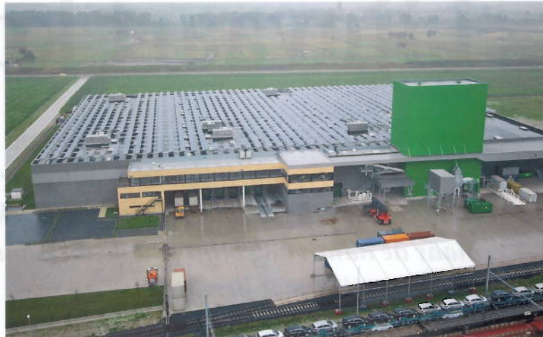
Seabridge beschikt over een spooransluiting met plaats voor meer dan 33 wagons, samen goed voor ongeveer honderd teu.